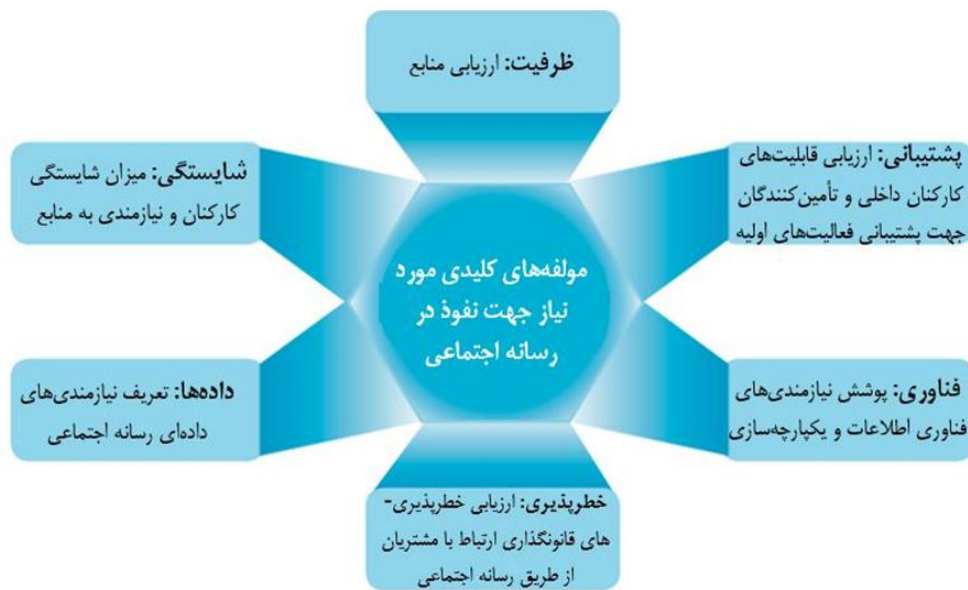
شکل ۱. مؤلفه‌های کلیدی مورد نیاز جهت نفوذ در رسانه اجتماعی

داده‌ها: از آنجایی که داده‌هایی حساس و در سطحی وسیع در دسترس قرار می‌گیرد (یعنی، اطلاعات شخصی از